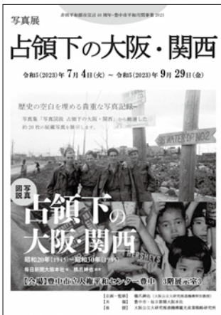
同写真展のチラシ

時7月4日(火)〜9月29日(金) 所 人権平和センター 豊中 内 写真集「写真図説 占領下の大阪・関西」(毎日新聞大阪本社編・橋爪紳也編著)から約20点の写真を展示 問 同センター ☎️ 6841・1313