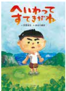
絵本作家・長谷川義史さんと著書「へいわってすてきだね」(ブロンズ新社)