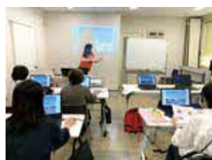
初心者でも分かりやすく学べます

時①8月28日(月)②9月25日(月) 14時〜16時 所エキスタとよなか 内①ワードで名刺作り②Zoomの利用方法 対文字入力ができる人、各9人 費用500円 甲市HPか、返信先明記の往復はがき(1人1枚)に共通、①