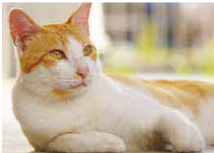
目標額達成後も募集期間中は寄付を受け付けています

市の財務・行政事務についての定期監査など(令和5年1月・2月・3月分)の内容が、市HPや市政情報