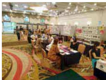
現場で働く職員から話が聞けます

時 8月10日(木)12時～16時 所 千里阪急ホテル 内 ホームヘルパー、送迎ドライバー、介護スタッフなどの仕事内容や働き方の相談ほか 問 府社会福祉協議会 ☎6762・9001