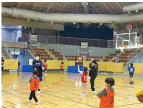
関西女子学生バスケットボール連盟から技術指導が受けられます

時 9月24日(日)10時〜11時30分 所 豊島体育館 対 小学生、100人 申 市HPか、はがき(1人1枚)に共通、学年、バスケットボール経験の有無を書き、〒561-8501豊中市役所スポーツ振興課バスケットフェスタ ☎6858・2751。9月14日(木)必着。抽選