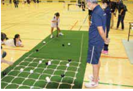
体力を問わず誰でも楽しめる囲碁ボール

時所(豊島) 9月2日(土)・10月7日(土)・11月4日(土)(庄内) 9月9日(土)・10月14日(土)(豊泉家千里) 9月16日(土)・10月21日(土)・11月18日(土)(柴原) 9月23日(祝)・10月28日(土)・11月25日(土)の各体育館。9時30分〜11時30分 ①ペンク、囲碁ボール、ソフトバレーボールほか ②持運動のできる服、上靴 ③関スポーツ振興課 ☎6858・2751