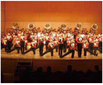
昨年の同フェスティバルの様子。今年は中学・高校・大学生が吹奏楽の演奏をします

時 10月1日(日)14時～15時45分 所 大阪音楽大学ザ・カレッジ・オペラハウス 対 300人 申 9月11日(月)10時～同大学コンサート・センターに来館。1人4枚まで。先着順 問 同センター ☎ 6334・2242