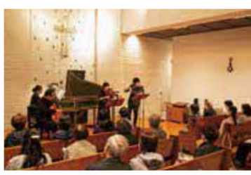
市内各所を会場にクラシックを演奏します