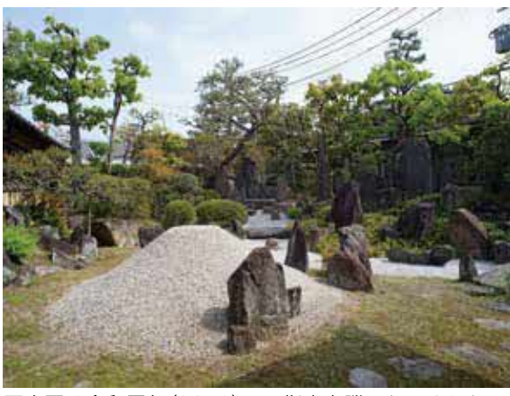
同庭園は令和元年(2019)に国指定名勝になりました

時 9月①29日(金)13時阪急石橋阪大前 駅集合～16時阪急豊中駅解散②30日