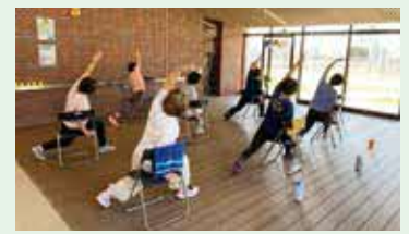
無理なく体を動かすセルフケアプログラムです