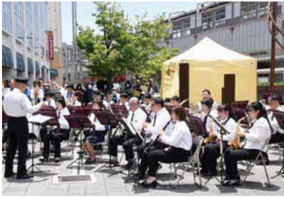
第1回マチなかコンチェルンでの阪急電鉄吹奏楽団の演奏

時 9月30日(土)(雨天時10月1日(日))11 時～12時 所 服部緑地レストハウス 時計塔前広場 問 魅力文化創造課 ☎ 6858・3208