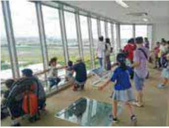
展望フロアからは離着陸する飛行機や、市街地が一望できます

時 内 ぐみ焼却施設見学会 10時15分〜、10時30分〜、13時30分〜。各15人。当日会場。先着順(家具リユースコーナー)不用となり持ち込まれた家具の展示、譲渡。11時30分まで受け付け。11時45分に抽選。搬出は各自