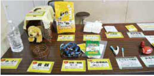
ペット(犬)の防災グッズ

9月20日(水)～26日(火)は動物愛護週間です。ペットを飼う前に、最後まで飼うことができるか家族で考え、飼うときは、鳴き声や臭いなどで近隣の迷惑にならないよう、日頃からしつけや健康管理を適切に行いましょう。ペットの防災グッズも準備