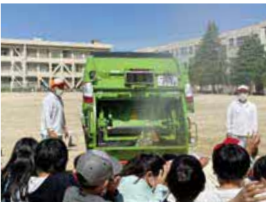
大迫力の収集車を間近で見学できます