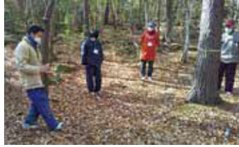
森で感じた匂いや音などを参加者同士で伝え合います

時①11月26日(日)13時～16時②12月2日(土)10時～16時(集合・解散は能勢電鉄山下駅) 所①庄内公民館②わっぱる(能勢町) 内野外プログラムを通して、子どもや自然との関わり方を考える 対青少年活動や自然体験活動などで子どもを指導している18歳以上の人、各20人 対12千円②5千円 申10月26日(木)から電話でわっぱる☎072・734・0301。先着順