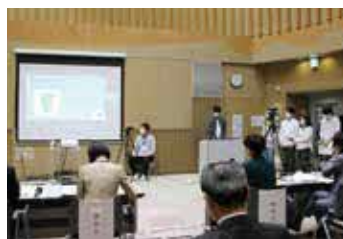
8組のグループが発表します