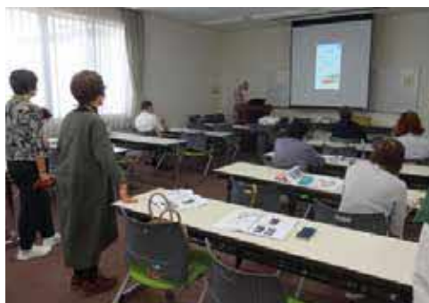
基本操作などを少人数で分かりやすく学べます

時運 ①10月・11月の第2・4金曜日(4回) 13時30分～16時30分②10月～3月の第4金曜日(6回。2月は3月1日に振り替え) 14時～16時 所 ①千里公民館②庄内コラボセンター「ショコラ」 対 ①12人②8人 ¥ ①2,000円②4,000円 申 ①10月5日(木) 10時～17時に電話で同館☎6833-8090。抽選②10月13日(金)10時から電話でショコラ☎6334-1251。先着順