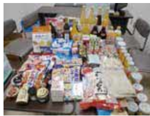
提供いただいた食品の一例

▼食品回収場所・日時Ⅱ(市内スーパリー11店舗)店舗詳細と時間は市HP参照へ市役所第一庁舎、環境事業所、社会福祉協議会へ10月30日(月)10時～15時 ▼受け取りできない食品Ⅱ消費・賞味期限が12月1日(金)以前のもの、生鮮食品、アルコール類、開封済みのものなど 減量計 画課☎6858・2279