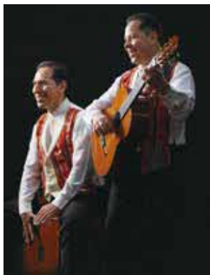
ペルー出身のユニット・フロレス兄弟によるラテン音楽の演奏

関① 輪投げ・おもちゃ作り・手芸ほか ② ラテン音楽の演奏会・フラダンスほか その他12時〜野菜・卵・竹炭などの有料配布(売り切れ次第終了)、ぐるっとフリー(景品あり)ほか