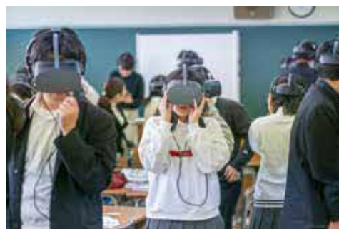
イベントのイメージ。座学だけでは実感が湧かない認知症特有の症状をVRゴーグルを装着して体験します