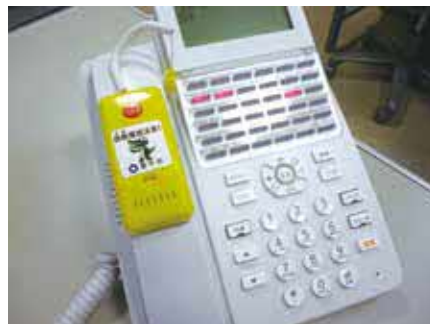
振り込め詐欺被害防止の警告音声がかかります

6日(月)10時～、12月13日(水)14時～ 千原公民館 <11月6日(月)14時～、12月13日(水)10時～> へうしかん <11月8日(水)14時～、27日(月)10時～、12月7日(木)・12日(火)14時～> 釜池公民館 <11月15日(水)14時～、12月22日(金)10時～> 他 取り付け説明あり 申 電話でくらし支援課 ☎ 6858・5073