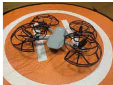
ドローンの操縦体験もできます