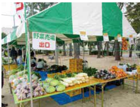
毎年新鮮な農産物が大人気です