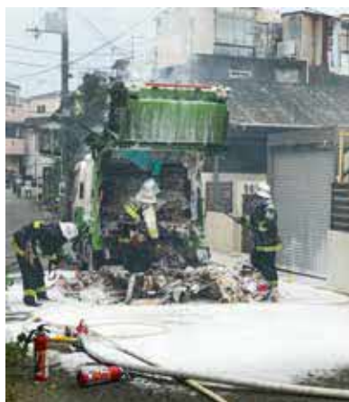
分別を誤ると、火災につながります