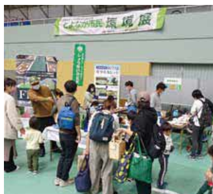
自然工作や小型家具リユースコーナーもあります

のリユース(1人10点まで、18日のみ)、スティージイベント(18日のみ)ほか 問とよなか市民環境会議アジェンダ21(環境交流センター内) ☎6844・86111