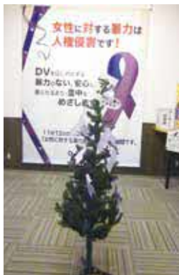
パープルリボンは女性に対する暴力根絶のシンボルです

時11月①13日(月)〜20日(月)(20日は15時まで)②21日(火)〜28日(火)(21日は13時から、28日は15時まで) 所市役所①第一庁舎②第二庁舎 内ポスター・パネル・ツリー展示