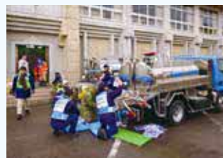
公民館で応急給水を実施