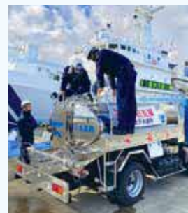
給水タンク車に補水する様子