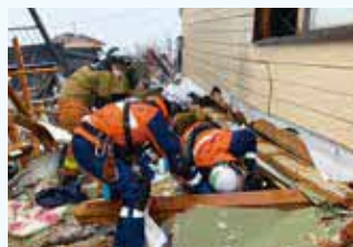
倒壊家屋からの救助活動