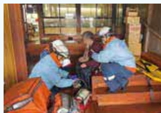
孤立集落で活動する救急隊