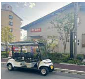
グリーンスローモビリティでの送迎も行っていますので希望の場合はお問い合わせください

時 2月4日(日)10時～15時30分 所 新千里東町会館 内 医療従事者による個別健康相談と計測(骨密度・肌年齢・体組成) 閏 都市整備課 ☎ 6858・2674