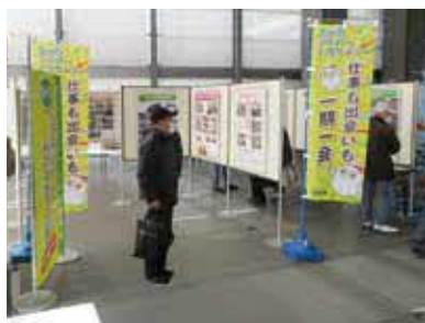
仕事や同好会、日々の活動のパネルを 展示

時 3月18日(月)・19日(火)10時～16時 所 市役所第二庁舎 内同センターの 事業紹介・入会案内、同好会の活動 報告、会員の制作物の展示 問同セ ンター ☎6856・1777