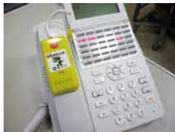
振り込め詐欺被害防止の警告音声が流れます