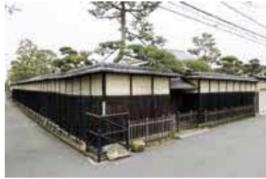
戦前の郊外住宅地の面影が残る高塚は、国の登録文化財です

時 3月30日(土)9時15分〜16時(見学は約40分。時間指定不可)。小雨決行 所 同庭園 対 中学生以上、100人 申 市HPか、返信先明記の往復はがきに共通、参加者(2人まで)の名前・年齢を書き、〒561-8501豊中市役所 社会教育課 ☎68558・2581。3月13日(水)消印有効。抽選