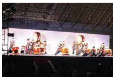
高校生がグループごとにパフォーマンスをします

時3月24日(日)13時〜16時30分 所豊島体育館 内演奏・ダンスほか 対千人 申当日会場。先着順 問い合わせ ☎6866・3030