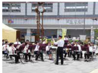
音楽を身近に楽しみましょう

時3月20日(祝)11時〜11時30分。雨天中止 所阪急曾根駅前 問魅力文化創造課 ☎6858・3208