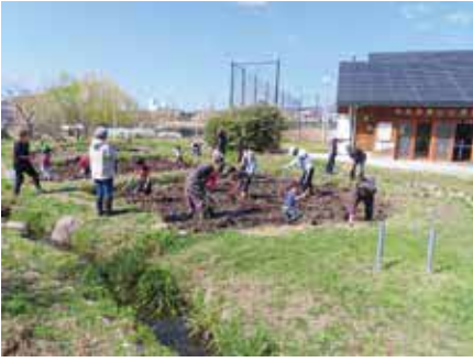
田んぼ体験の様子

● 田んぼ体験 時 ① 3月17日(日)13時30分～15時30分 ② 4月7日(日)10時～12時 内 ① 田起こし ② 代かき準備、もみまき 対 各30人