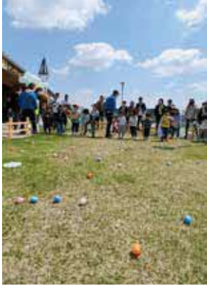
イースターエッグをみんなで探し出そう