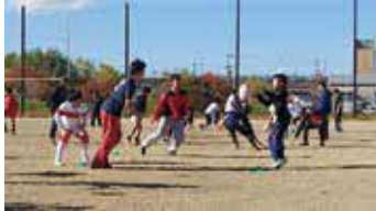
同世代の仲間たちとラグビーを体験しよう

時 4月14日(日)13時〜 所 マリンフー ド豊中マルチグラウンド 対 小学6 年〜中学1年生、100人 申 4月12日 (金)8時まで市HP。抽選 問 スポーツ振興課 ☎ 685 8・3309