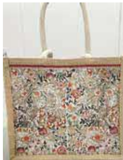
日常に彩りを添えるバッグを作ります

所 同センター 申 4月5日(金)から同センター(10時～16時) ☎6831・0590。先着順 デコパージュで飾るエコバッグ作り 時 4月25日(木)13時～15時 対 5人 料 ¥千円