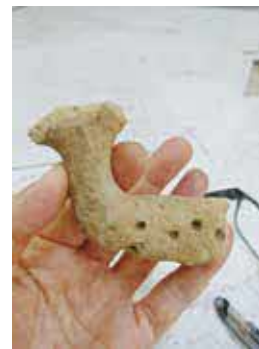
新免遺跡(立花町)から出 土したシカの土製品

線刻が入った土器やシカの土製品な ど出土遺物の展示 ㊟展示解説あり (①5月4日(祝)②5月18日(土)③6月 1日(土)④6月15日(土)。14時〜14時30 分) ㊟同館 ☎63334・2551