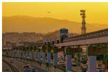
島熊山からの夕焼けとモノレール。よ〜く見ると飛行機も。