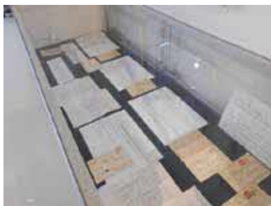
当時の手紙や絵はがきなどを展示します

時 4月1日(月)〜5月25日(土) 所 人権 平和センター豊中 対市に寄贈され た昭和初期から昭和20年ごろまでの 戦争遺品ほか 所 同センター 6 841・1313