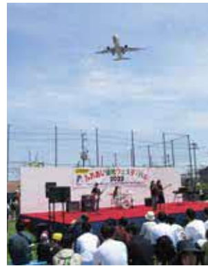
高校生によるダンスやバンド演奏などもあります

時5月3日(祝)11時〜15時。雨天中止 所ふれあい緑地 対ステージ発表、飲食ブース、野菜・花苗販売、レンゲ摘み体験ほか 対公園みどり推進課 ☎6843・4000