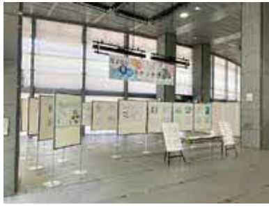
今年は第十二中学校の生徒の作品を展示します

時 5月14日(火)〜17日(金)(14日は13時から、17日は15時まで) 所 市役所第二庁舎 問 都市計画課 ☎ 6858・3143