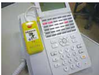
振り込め詐欺被害防止の警告音声の流れます

時 所 庄内公民館 5月9日(木)10時～、6月14日(金)14時～千里公民館 5月9日(木)14時～、6月14日(金)10時～(蛸池公民館) 5月13日(月)10時～、6月19日(水)14時～くらしかん 5月13日(月)14時～、29日(水)10時～、6月6日(木)10時～、18日(火)14時～中央公民館 6月24日(月)14時～ 他 取り付け説明あり 申 電話でくらし支援課 ☎6858・5073