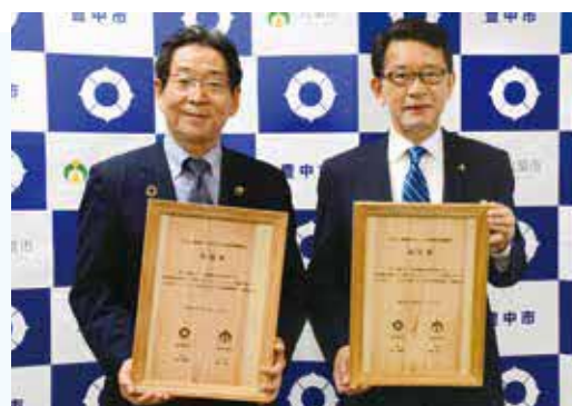
(左) 福元晶三宍粟市長 (右) 長内繁樹豊中市長