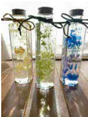
瓶にオイルと花を入れて作るインテリア

時5月25日(土)、6月1日(土)・8日(土)14時〜15時 所高川センター 対10人 ¥100円 申5月11日(土)14時に同センターに来館。先着順 癒やしのハーバリウム作り 時5月26日(日)10時〜11時30分 対10歳以上、15人 ¥千円 申5月1日(水)10時〜17日(金)17時に電話で同館。先着順