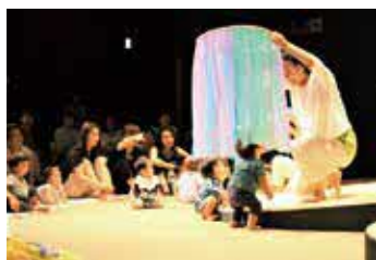
劇団風の子九州による、音やリズムで楽しむ舞台作品

時 6月8日(土)13時30分~ 内 同センター 対 レジデントアーティストほかによるクラシック音楽の演奏 対 446人。5歳未満入場不可 ¥ 一般500円ほか 申 同センターほか。先着順