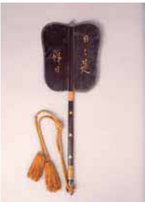
麻田藩主・青木一重使用と伝わる軍配(市指定文化財)

時5月5日(祝)・12日(日)・22日(水)・29 日(水)14時〜14時30分 所郷土資料館