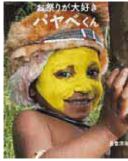
「お祭りが大好きパヤベくん」写真家・長倉洋海 著(アリス館)

時5月1日(水)〜30日(木)10時〜17時 所①岡町②庄内の各図書館 内写真 絵本「ともだちみつけたー!」シリーズ のパネルや著作の展示(①②は別内 容) 問各図書館①岡町☎6843 ・4553②庄内☎6334・12 61