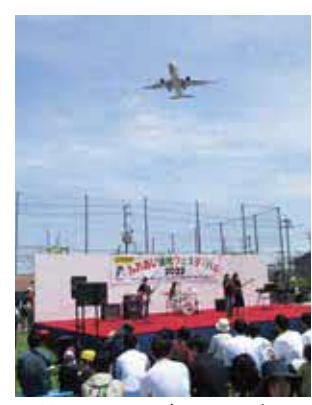
高校生によるダンスやバンド演奏などもあります

時5月3日(祝)11時～15時。雨天中止 所ふれあい緑地 対ステージ発表、飲食ブース、野菜・花苗販売、レンゲ摘み体験ほか 対公園みどり推進課 ☎6843・4000