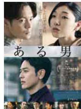
平野啓一郎さんの小説が原作のヒューマンミステリー

とよ キネマ ある男 時 5月24日(金)11時~、14時30分~、19時~ 対 各回446人 ¥ 千円ほか