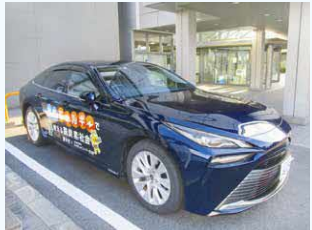
豊中市では燃料電池自動車MIRAIを導入しています