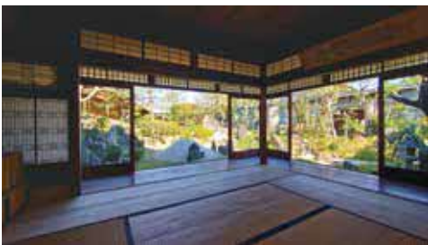
国登録有形文化財・西山家住宅離れから見た西山氏庭園(青龍庭)