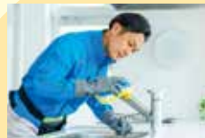
家事代行サービス