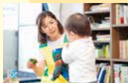
ベビーシッターサービス