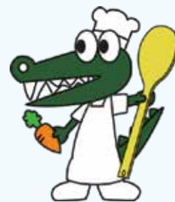
豊中市公式キャラクター マチカネくん