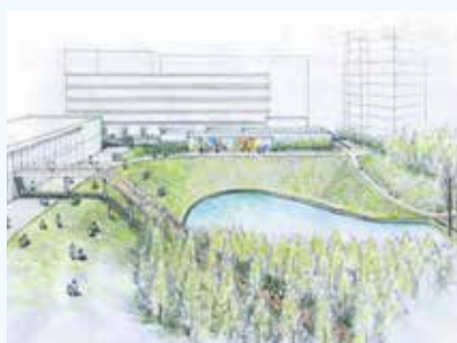
千里東町公園 再整備イメージ図

再整備に先立ち、千里東町公園には、企業版ふるさと納税による寄付遊具を活用し、市内で初めて主に乳幼児を対象とした広場を整備します。同広場には、乳幼児が安心して遊べる遊具や人工芝を整備し、令和8年7月の利用開始を予定しています。