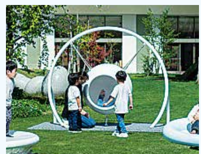
寄付遊具イメージ (寄付企業HPより)