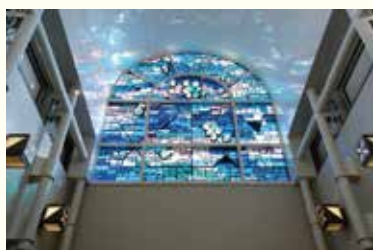
2025年11月27日撮影 野畑図書館にて

図書館の2階にあるスタンドグラスは、1988年の開館当時から変わらない柔らかな光と色彩で来館者を迎えています。市公式noteで当時の写真や地域の歴史を振り返っていますのでぜひご覧ください。