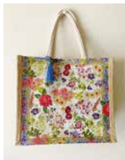
A4サイズが入る麻織りのバッグをコーティングします

時 2月25日(水)10時～12時 所 千里介護予防センター 対 65歳以上、10人 ¥ 千円 申 2月5日(木)から電話(10時～16時)で同センター ☎ 6831・0590。先着順