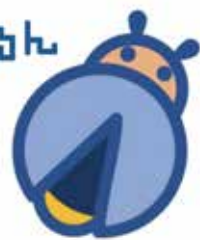
ほたるんを探してスタンプをもらおう

時 4月1日(水)〜28日(火) 所 同館 内館 内に隠されている「ほたるん」を探し、カードに必ず本を書いて掲示 蛭池図書館 ☎6840・8000 問