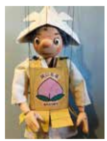
マリオンネットのモモタロー

アートマネジメント講座 時 連 5月16日(土)10時30分〜12時ほか(全5回) 内 社会・地域におけるアートの役割や関わり方 対 大学・短大・専門学校生以上、20人程度 ¥ 一般3千500円ほか 申 4月16日(木)から同センターHP。先着順