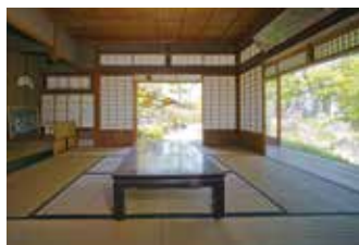
整備完了後の離れ座敷で落語を楽しみませんか

千里家圓九さんほか 時4月25日(土)14時〜15時30分 各20人 申4月1日(水)〜15日(水)に市HP。抽選