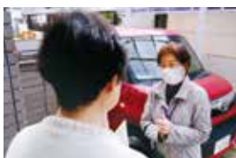
高齢者の見守りや訪問