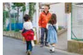
子どもの見守り活動