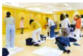
地域の居場所づくり