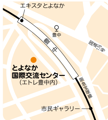
阪急豊中駅から西に約100m

時 6月19日(金)10時～13時30分 所 とよなか国際交流センター 内 同国出身の講師と同国料理を作って交流 対 20人 ¥2千500円 申 6月4日(木)10時から市HPか電話。先着順 関 とよなか国際交流センター ☎6843・4343