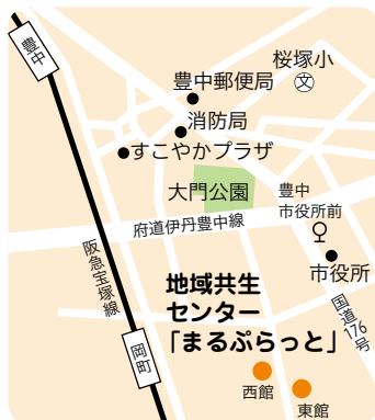
阪急岡町駅から東へ約350m

時6月23日(火)14時~16時 所 まるぶらつと西館 内 事業計画ほか 対 5人 問 長寿安心課 ☎6858・2866