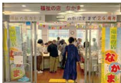
阪急豊中駅北改札口を出てすぐです

9 「なかま」 内 障害者福祉事業所の手作り品展示ほか 他 粗品進呈(先着100人) 問 社会福祉協議会 ☎6848・1279