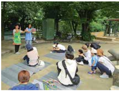
絵本の読み聞かせや育児相談もあります