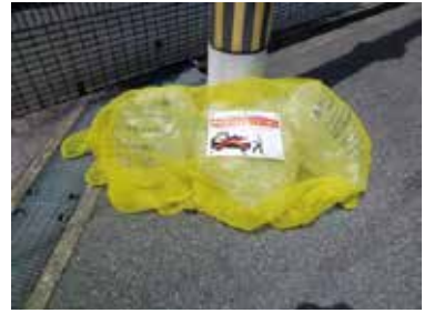
ごみ収集終了後は、ネットを速やかに片付けるようご協力をお願いします

☎おおむね6世帯以上が利用するごみステーションの管理責任者 申 市HPか、申込用紙(市HPでDL可)を提出 問 家庭ごみ事業課 ☎6843・3512