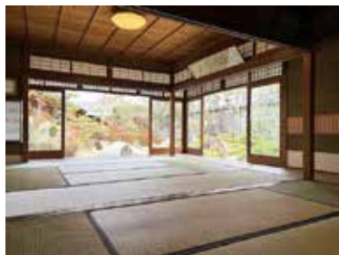
離れ座敷で文化財と英語に触れませんか