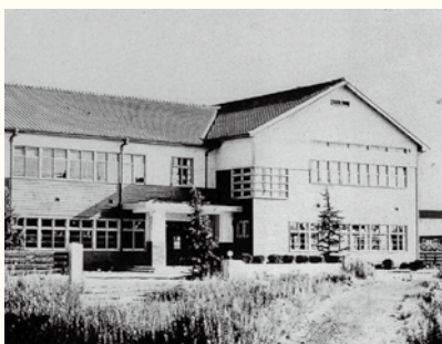
1938年に完成した市庁舎

4月号から4カ月にわたりお届けしている90周年特集「豊中90年の歩み」。90周年をきっかけに、皆さんにもっと豊中市のことを知ってもらえるよう、市公式noteでも当時の豊中を詳しく紹介しています。ぜひご覧ください。