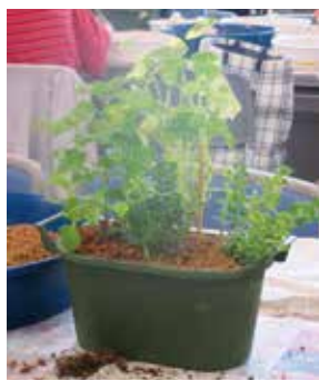
料理などに使えるハーブの知識を学びます

時 6月17日(水)13時30分〜15時 対15人 ¥600円 申 6月2日(火)10時〜9日(火)17時に市HPが電話。抽選