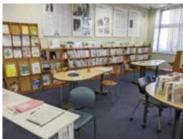
市立学校で使用する全ての教科書を展示します

時 ①6月12日(金)～7月3日(金)②6月22日(月)～26日(金)10時～16時(初日は12時から) 所 ①教育センター②シヨコラ 問 教育センター ☎6844・5290