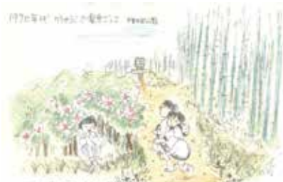
作者の子どもの時の遊びを絵で次世代へ伝える作品展です

文化芸術センター 〒561-0802 曾根東町3-7-2 ☎06-68664-5000 ☎06-68663-0191 施設の催し は7月29日(水) 所マリノフード豊中テニスコート 申 7月3日(金)必着 市民Basketボール大会(中学生) 時 8月1日(土)～3日(月)9時～ 所庄内体育館ほか 申 6月15日(月)必着 指導者・審判講習会など ▼競技Ⅱ水泳 絵でたどるこどもの遊び展 こどもは遊びの天才 時 6月25日(木)～7月5日(日)10時～18時(最終日は17時まで) 所市民ギャラリー(最終日は17時まで) 他 6月27日(土)・28日(日)13時30分～15時30分に大人向けワークショップあり(先着10人。要申し込み。詳細は同センターHP参照)