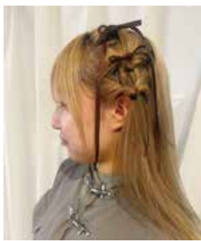
ヘアアレンジの一例

時 6月29日(月)10時30分〜12時 対40人 申 6月8日(月)14時から電話。先着順 時 7月5日(日)10時〜11時30分 対肩を