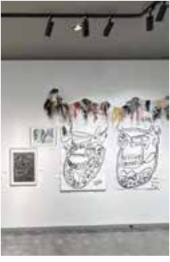
自由な発想と個性ある作品が並びます

6月3日(水)～6日(土)10時～19時(6日は16時まで) 所 市民ギャラリー 市内障害福祉サービス事業所の利用者が制作した絵画やオブジェの展示 ☎障害福祉課 ☎6858・3282