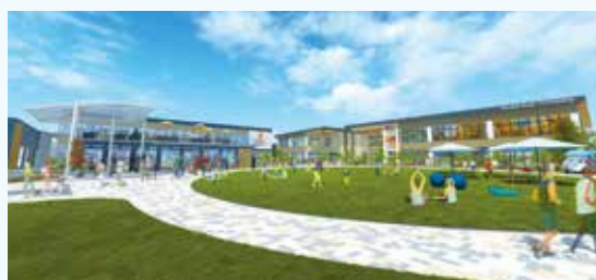
事業者提案イメージ図