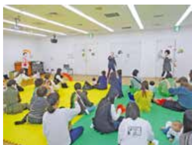
音楽に合わせて遊びましょう

時 7月2日(木)10時〜11時30分 内絵本の読み聞かせ、ふれあい遊びほか 2歳未満の子どもの保護者、20組 申 6月8日(月)〜15日(月)に市HP。抽選