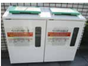
ペットボトル回収ボックス