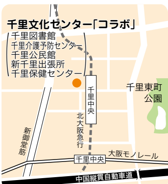
北大阪急行千里中央駅から北西へ約80m