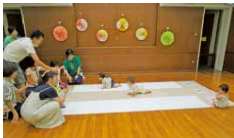
親子で楽しめる人気のプログラムです