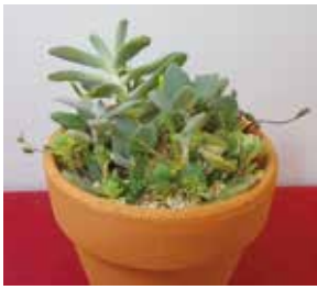
寄せ植えのイメージ

時 6月27日(土)10時～12時 所 花とみどりの相談所 対 24人 ¥千円 申 6月