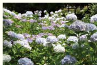
2024年6月19日撮影 皿池公園にて

皿池公園では、園内の池の周りを囲むように、色鮮やかなアジサイが咲いています。市内のアジサイスポットは、市公式YouTube(とよなかチャンネル)でも紹介しています。この時季ならではの景色をお楽しみください。