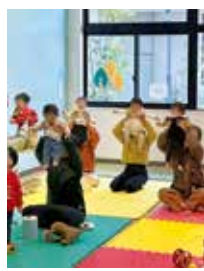
遊びを通して心と体を育みます