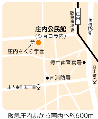
阪急庄内駅から南西へ約600m

超える髪の長さの小学4年生以下の子どもと父親、20組 申 6月14日(日)までに市HP。抽選