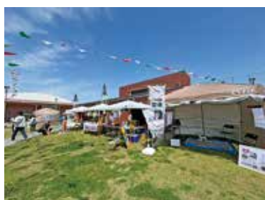
6月は犬と一緒に楽しめる催し、 7月はシャボン玉遊びをします

時 6月6日(土)10時〜16時、7月4日(土) 15時〜20時 所 グリーンスポーツセン ター 内 軽食・飲み物・犬のグッズ販 売ほか 問 グリーンスポーツセンター ☎6398・7391