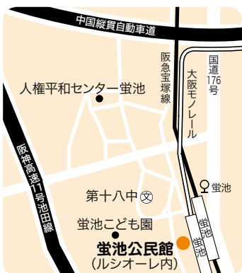
阪急蛸池駅から西へ約100m