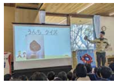
天王寺動物園の飼育員から話が聞けます

時6月28日(日)14時30分〜15時45分 所蛸池公民館 因動物園の知られざるエピソードや、動物の本の紹介 対5歳以上、70人。未就学児は保護者同伴 申当日会場。先着順 問岡町図書館 ☎6843・4553