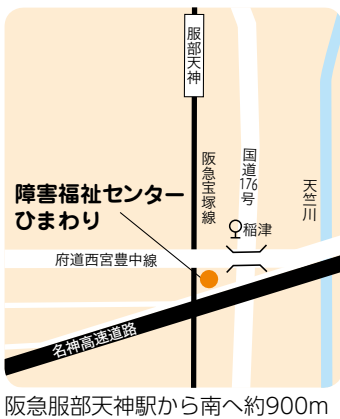
阪急服部天神駅から南へ約900m

時 内①フライングディスク体験 6月27日(土)13時30分～14時30分 ②映画上映会「はたらく細胞・実写版」7月29日(水)13時30分～15時30分 所 ひまわり 対 ①12人 ②50人 申 6月3日(水)から電話かファクス(共通) ①か②、ファクス番号を記入。先着順 問 府社会福祉事業団 ☎6335・4595、FAX 6335・4775