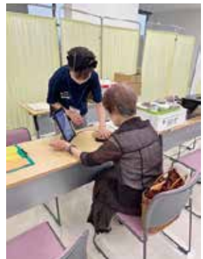
手のひらをセンサーに当てて推定野菜摂取量を測定します

(1人60分) 対 18歳以上、各20人 申 6月11日(木)9時30分から電話。先着順 健康推進課 ☎6858・2879