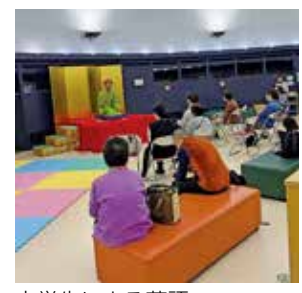
大学生による落語