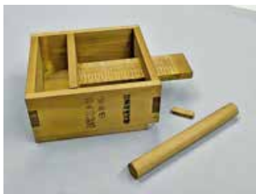
当時の節米調節器など、郷土資料館の 所蔵資料も展示します

時 ①6月29日(月)〜8月22日(土)②9月1 日(火)〜11月20日(金)。9時〜17時 所人 権平和センター①豊中②蛍池 内 戦時 中の食生活に関する資料やパネルのほ か、当時使われていた釜などの実物展示 問 人権平和センター①豊中 ☎68441 ・1313②蛍池 ☎68441・5326