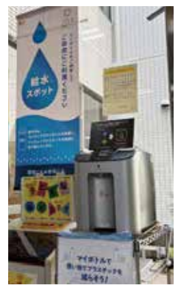
冷水と常温水が出るマイボトル用給水機