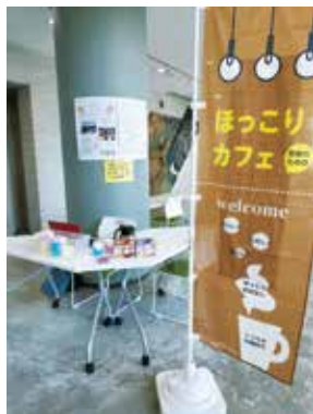
コーヒーや紅茶などを提供し ます(1人1杯)

時 6月・7月の土曜日10時〜11時30分 所 いびき 対 中学・高校生、各回20人 申 当日会場。先着順 問 北摂こども文 化協会 ☎072・761・9245