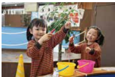
小型淡水魚を釣ってみよう

時 7月4日(土)8時45分～16時。集合・解散は市役所 所 オープンスペース(三木市ほか) 対 ひとり親家庭の4歳