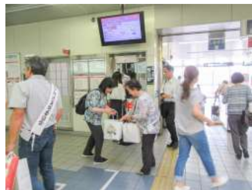
過去の駅頭啓発活動の様子

内容：豊中地区保護司会などの市民団体や長内市長、 市職員らによるポケットティッシュの配布