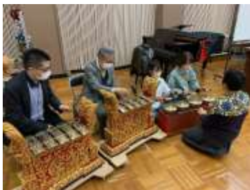
昨年のワークショップの様子

https://www.city.toyonaka.osaka.jp/jinken_gakushu/bunka/event/ev_music/sekainoshonai_2023.html