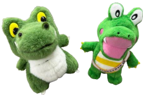
ワニ博士とマチカネくん