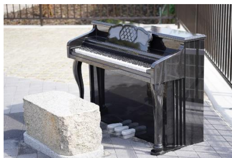
オペラ通り沿いに設置された石造りのピアノ