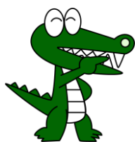
豊中市キャラクター マチカネくん