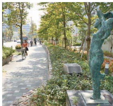
新千里西町2丁目の歩道

千里地区の良好な道路空間の形成を目的に整備された市道新千里5号線。歩道には、自然と調和し、通る人の心が豊かになればとの思いから、彫刻を配置しています。平成7年(1995)には「千里アートロード」の愛称が付けられました。