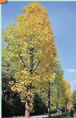
紅葉するユリノキ並木

市道千里西町外回り線沿いには、新千里西町の木でもあるユリノキが植えられています。ユリノキは、2キロメートルにわたり約200本植えられていて、5月頃に淡い黄色の花を咲かせ、まちに彩りを添えます。