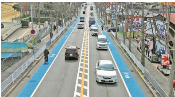
両側の青色部分を自転車が走ります。