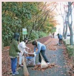
約25人のメンバーが参加

街路樹の落ち葉を気にせず、気持ちよく通れるようにと桜坂で10年にわたって清掃活動を行う北緑丘サンサングループ。今ではごみのポイ捨ても少なくなり、活動中に「ありがとう」と声を掛けてくれる人も。まちを美しくする運動はこれからも続きます。