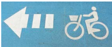
進行方向を示す自転車通行空間のマーク

第十四中学校の正門前にある坂道は、地域の人から「心臓破りの坂」と呼ばれるほど急勾配で有名。周囲に学校や店舗があり歩行者の利用が多く、自転車との事故を防ぐため、昨年市内で初めて自転車通行空間が整備されました。