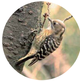
緑道の入口付近でコゲラの姿が