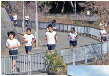
北緑丘小学校の5年・6年生のマラソンコースにもなっています