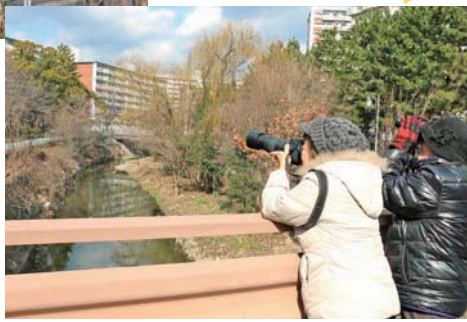
バードウォッチングに訪れる人も