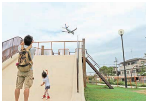
飛行機が頭上を飛んでいます

航空機の騒音や排気ガスの環境対策などのために、移転した民家などの跡地を整備してできました。飛行機が真上に飛ぶのを見ることができ、その迫力は見る人を引き付けます。