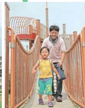
3つの滑り台がある遊具は子どもたちに人気