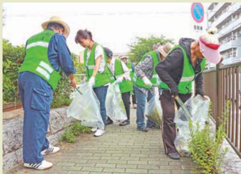
月1回活動しています

「自分たちのまちをきれいになりたい」という思いで、13年前に清掃活動を始めました。平成19年(2007)には、地域の人たちにも「ごみを捨てない、まちを汚さない」という意識をさらに高めてもらおうと、市内で初めて「まち美化活動協定」を宣言しました。