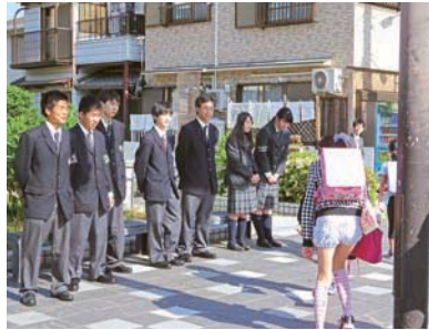
元気にあいさつしています

登校する児童の安全を守ろうと10年前から始まったこの運動。同校生徒会メンバーが週に1回、豊島北小学校(曾根南町)東側の歩道で活動しています。