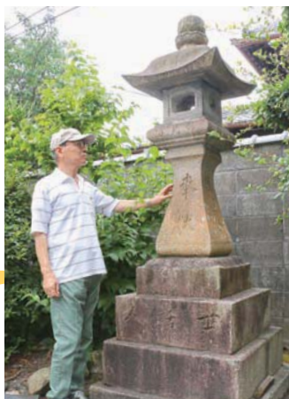
見上げるほどの高さがあります

境内にある高さ243センチメートルの常夜灯。もとは能勢街道沿い(服部元町2丁目付近)に立っていたそうです。街道を行き交う人びとの交通安全を祈願する文字が刻まれています。