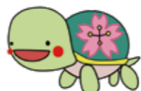
豊中市保健所公式キャラクター「とよなっカメ」

年度内(3/31まで)に接種を完了するには、 1回目の接種を9月30日までに開始する必要があります。 期間に余裕をもって接種を開始しましょう。