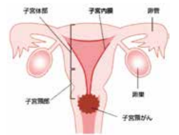
図：日本産科婦人科学会より引用