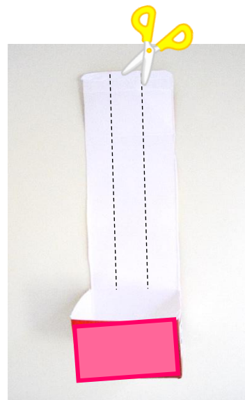
残った面の両端から2cm位を切り離します。