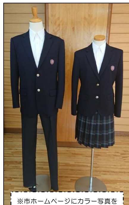
※市ホームページにカラー写真を掲載しています。