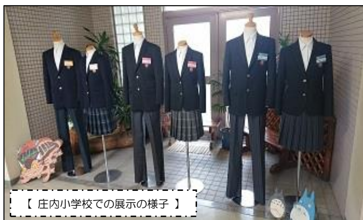
【 庄内小学校での展示の様子 】