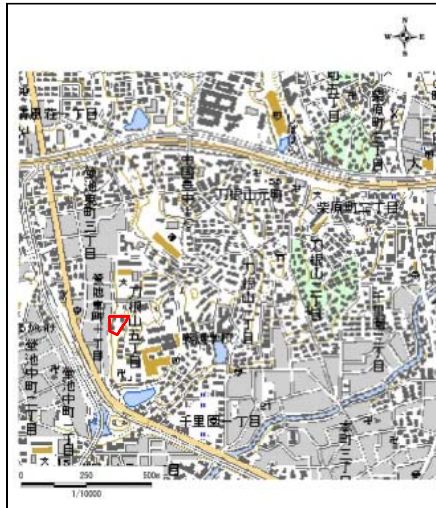
区域指定箇所位置図(1/10,000)