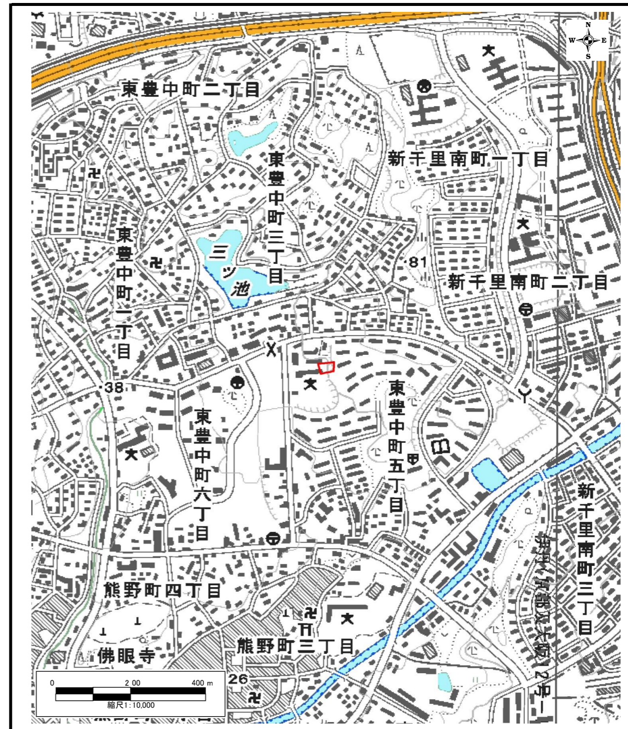
区域指定箇所位置図(1/10,000)