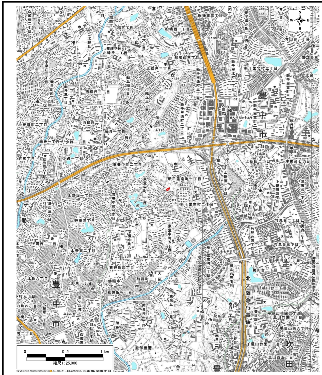
区域指定箇所概略位置図(1/25,000)