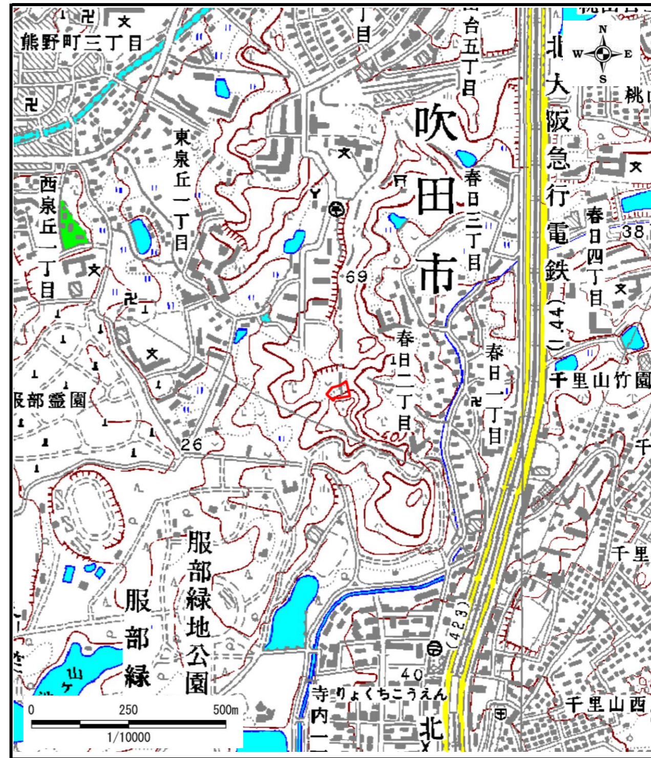
区域指定箇所位置図(1/10,000)