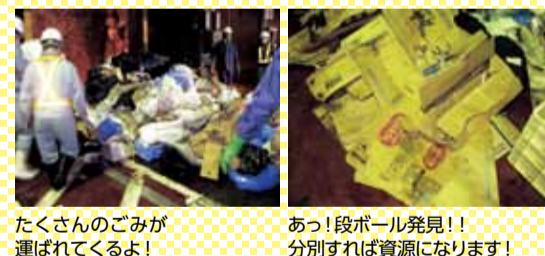
たくさんのごみが選ばれてくるよ！ あっ！段ボール発見！！分別すれば資源になります！

～クリーンランド(ごみ処理施設)で、ごみ搬入検査をしています～ 事業所から出たごみの分別状況を検査して、違反物混入の有無を確認し、ごみの減量・リサイクルの推進に取り組んでいます。