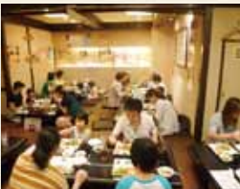
おやこ・子ども食堂

現在、毎月第4日曜日に、NPO法人庄内わんぱくの社と豊中市の後援で実施しています。「おやこ・子ども食堂」と名前に入っていますが、地域の人が集まり、笑顔がいっぱいある場所にできたらとの思いで運営していますので、シニアの方も是非ご参加ください。私達の子ども食堂では、これまでに、お寿司づくり等の料理教室を開いたり、店で働くアルバイトの大学生が、子ども達に勉強で分からないところを教える取組みも併せて進めてきました。これからもたくさんの方に参加していただき、交流を深めてもらいたいと思います。