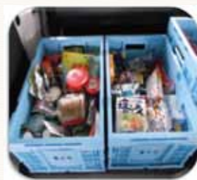
《提供された食品等》