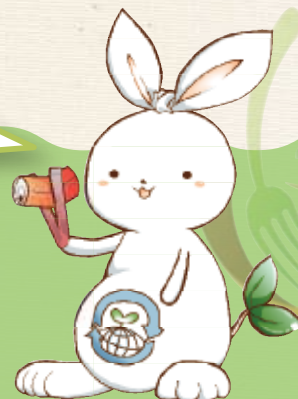
豊中市ごみ減量PRキャラクター「リサビット」

食生活における「もったいない」の“気づき”によりごみを減らそうという思いを込めて、この冊子を作成しました。