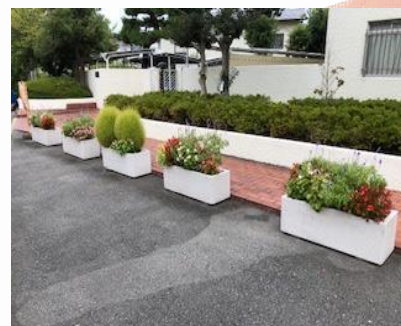
マンション入り口付近の 花壇

居住者皆さんで取り組む「可燃ごみ減量チャレンジ月間」に、市が配布する「雑がみ保管袋」を活用することで、雑誌・雑がみの回収量を増やすことに成功されました。