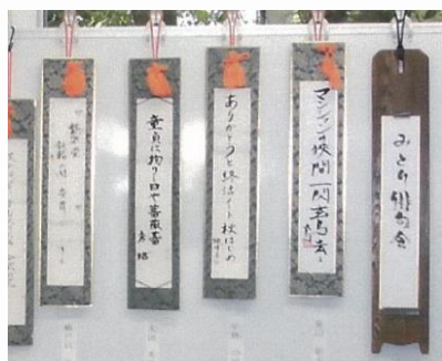
俳句展のようす 入賞者へは記念品が贈られる

（グ） チャレンジ期間終了後に居住者に配布する市指定ごみ袋の購入や、俳句やガーデニングなどの様々なサークルの活動費、行事の際の費用などに充てています。