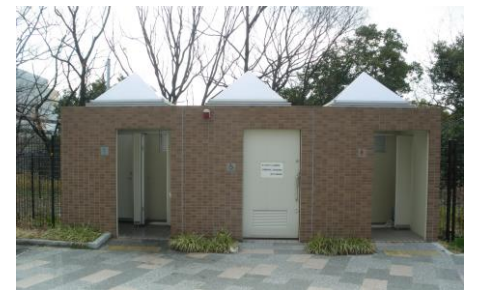
羽鷹池公園 利用時間 (8:30~17:30)