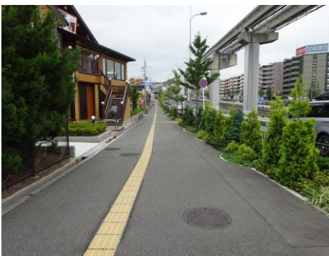
大阪中央環状線北側