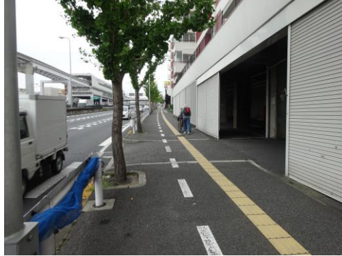
大阪中央環状線南側