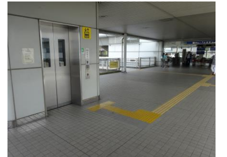
利用時間 (5:21~24:00 過ぎ)