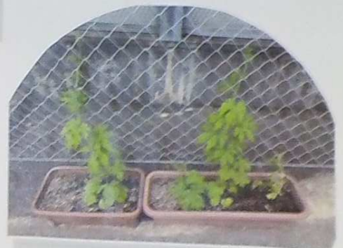
6月24日 〈3畳側芝生席〉 順調に成長中 ○○○