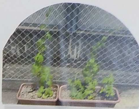
6月27日 〈3畳側芝生席〉 ゴーヤ 4本とも順調に成長