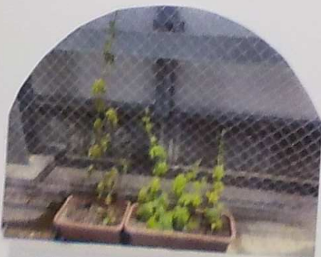
7月7日 〈3畳側芝生席〉 ○○○ 7月7日 観察が1回目