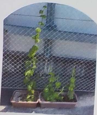
7月4日 〈3畳側芝生席〉 緑のカーテンできるかも・・・!