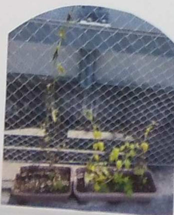
7月11日 〈3畳側芝生席〉 期待もなく、悲しい姿に・・・涙