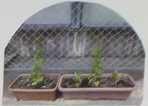
6月20日 〈3畳側芝生席にお引越し〉 1ゲート入口は、日照し足りないのでは? (部長の声)