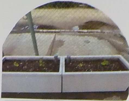
6月9日 〈1ゲート入口〉 ゴーヤの苗を植えました 元気に育って~~~~!!