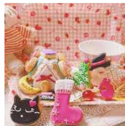
3月はかわいいお菓子 アイシングクッキー作り

アイシングは可愛くていろんな技術があり、奥深い魅力的なクッキーです。お友達やご家族へ作ったアイシングクッキーをプレゼントするのも素敵です。お菓子作りに集中する時間を楽しんでください。