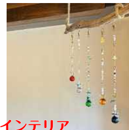
2月はお部屋のインテリア サンキャッチャー作り

自分で簡単に作れる窓辺のインテリア。 窓枠やカーテンレールに下げて、太陽のキラキラを部屋に取り込んで、癒し空間を作ってくださいね。