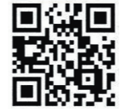
★防災倉庫までの案内動画はこちら

協議会のことをもっと知ってもらい、住民だけでなく、地域で活動するあらゆる団体の協力を得て、地域のためにより幅広い事業をやっていきたいです。その為には、みんなが得意なことを無理せず、助け合ってやれる関係であること、これに尽きると思います。今は何よりも楽しんでやれる雰囲気がいいですね。仲間を増やして、みんなとわいわいやっていけたらいいなと思っています。