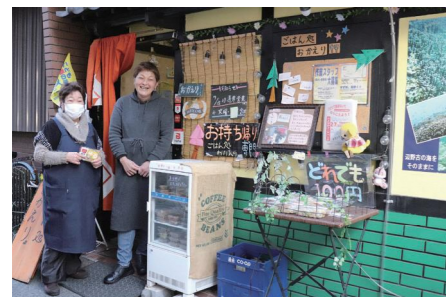
おかえり前で。笑顔でお待ちしています！

とよなか地域創生塾にはいろいろな立場の方が関わっています。それまではボランティア活動するにしてもほぼ一人で活動していたのですが、とよなか地域創生塾で周りの人に支えられる体験をしました。そこでは本当の人間関係を学んだと思いますし、その人間関係は今でも生きていて私の財産になっています。