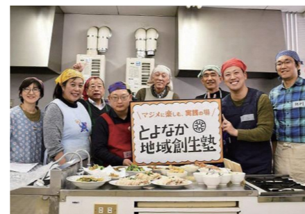
「男の料理教室(入門編)」参加者の皆さんと

色々な人と知り合えたことなど、良かったことはたくさんあります。その中で特に、企画づくりから実際に活動するまでの一連の流れを体験させてもらったのが、すごく良い経験になりました。とよなか地域創生塾に参加している人は、本当に様々な立場の人がいて、元々色々な想い、考え方を持っていて集まってきたんですね。そのような中、企画をまとめて実践までもっていくのは大変なことも多かったのですが、みんなの方向性がまとまり一つになれる時は快感の一言でした。今でも忘れられない貴重な体験をさせてもらったと思っています。