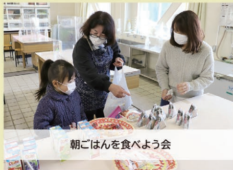
朝ごはんを食べよう会