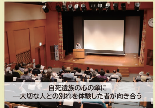
自死遺族の心の傘に ～大切な人との別れを体験した者が向き合う～

この助成金は、令和4年度(2022年度)豊中市予算の成立が前提であり、今後、内容等が変更になることもありますので、あらかじめご了承ください。新型コロナウイルス感染拡大防止のためマスクの着用、手指消毒にご協力ください。発熱や体調不良がある方はご遠慮ください。