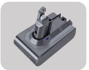
掃除機用バッテリー