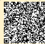
水銀使用廃製品 電池類