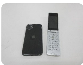
スマートフォン・携帯電話