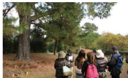
写真-23 新千里西町の千里緑地・島熊山緑地 (撮影年不明)

気に入ったコースを巡るのもよし、コースを外れて寄り道や近道を見つけて我が道を行くのもよし。時間と体力に合わせて千里ニュータウンの自然散策をお楽しみください。