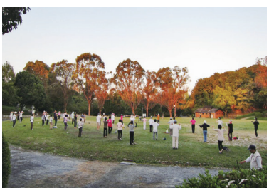
6 千里南公園・円形広場での朝のストレッチ体操