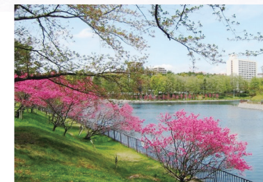
2 桃山公園・春日大池の花桃・竹林

「春日大池」の水辺には「ラクウショウ(落羽松)」の「気根」がコブのように地上にのびています。桜が咲く前には「花桃」が咲き、池の水面に赤く映る美しい景観を楽しむことができます。