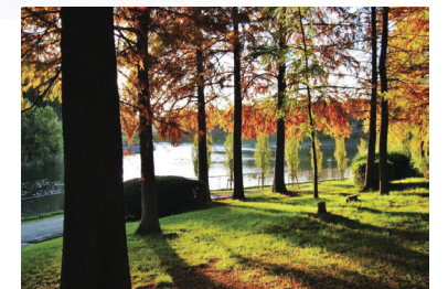
2 桃山公園・ラクウショウの林