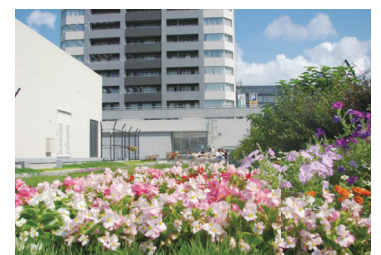
屋上庭園は憩いの場となっています。