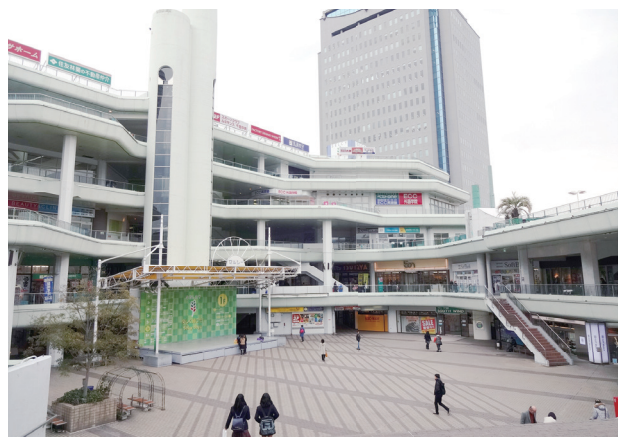
セルシー広場、昭和47年(1972年)にレジャーセンターとして誕生