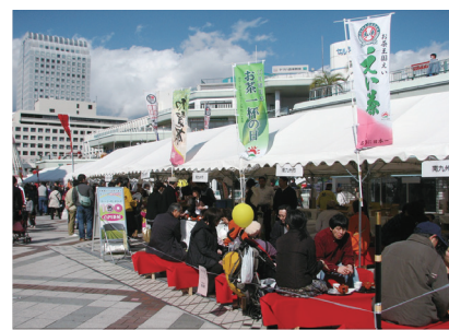
ふるさとの味が集まる、全国の観光物産展