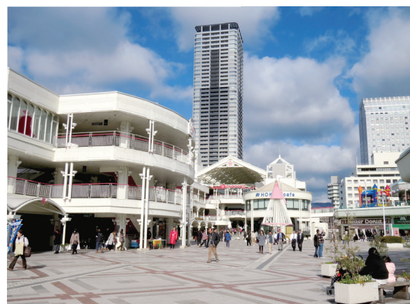
多様なイベントが開催されている、パル南広場