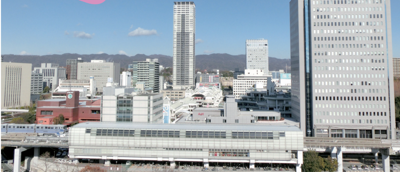
南側(上新田側)から望む千里中央全景

広場を取り囲む千里中央の建物群の景観は、大阪北部のランドマークを形づくっています。その姿は、飛行機からも新幹線からも眺めることができます。