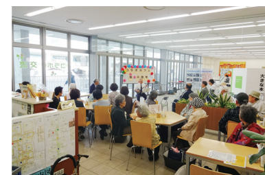
様々なイベントが行われています。