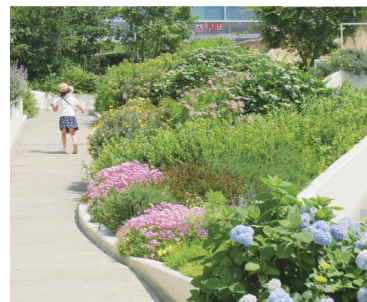
美しく彩られた花広場

千里中央の大きな魅力のひとつは「広場」です。ショッピングモールで結ばれた南北の広場では、全国各地からの観光物産展や音楽イベントが開かれ、多くの人たちでにぎわいます。