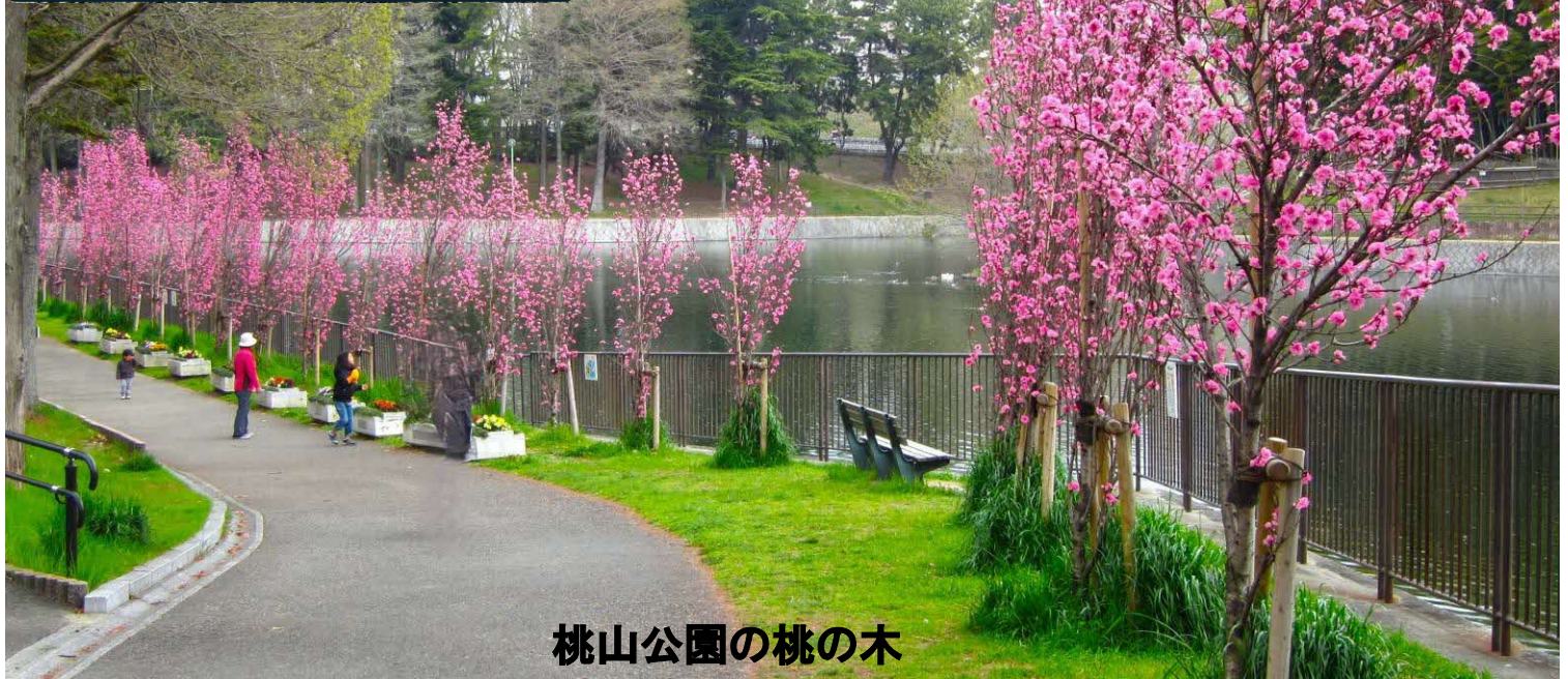
桃山公園の桃の木