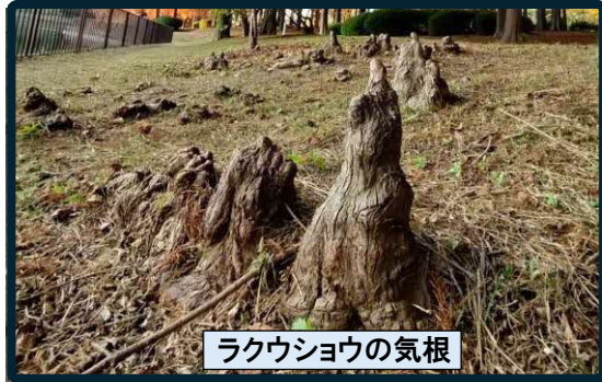
ラクウショウの気根